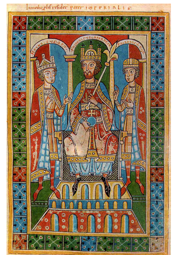
Imagen del emperador Federico Barba roja I, de la época

En la política se mantuvo un orden similar al del imperio carolingio, pero aparecieron dificultades entre iglesia y política, puesto que ambas partes querían interferir con el poder de la otra. La iglesia cometía simonía, que era la compra o venta de lo espiritual con cosas materiales. Estas situaciones causaron diversos conflictos entre ellos el llamado conflicto de las investiduras, porque los nobles querían que los cargos de la iglesia fueran de sus alianzas y la iglesia quería que se les respetara su independencia, pero igualmente querían intervenir en política. En el norte de Italia se generaron grandes contiendas políticas con el partido de los güelfos a favor del Papa y el partido de gibelinos, a favor del emperador.