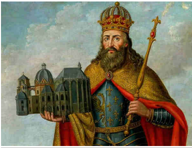
Carlo Magno con una miniatura de su colección

En cuanto a la política, el emperador era el máximo poder, el imperio se dividía en condados con condes encargados de la administración de esas tierras, además algunos territorios fronterizos que eran conocidos como marcas o comarcas a cargo de un marqués. Como la iglesia tenía el control económico y de la forma de pensamiento, en ocasiones entraban en conflicto con la política.