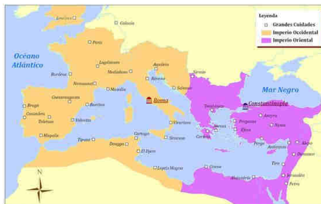
Mapa del Imperio Bizantino

Este imperio se originó finalizando la edad anterior, la antigua, cuando el imperio romano decidió dividirse en dos porque su tamaño era tan grande que hacía muy difícil poderlo administrar, entonces a la muerte del emperador romano Teodosio, se decidió dividirlo entre sus dos hijos en el año 395, en el que la parte occidental con capital en Roma se siguió llamando imperio Romano y quedó a cargo de Flavio, mientras que la parte oriental quedó a cargo del segundo hijo Arcadio y se comenzó a llamar Imperio Romano de Oriente con capital en la ciudad de Bizancio, por lo que con el tiempo tomó el nombre de Bizantino. La ciudad de Bizancio ha tenido tres nombres, el segundo fue Constantinopla, en honor al emperador Constantino, y el tercero es el actual de Estambul, hoy en día en Turquía. El imperio Bizantino fue el más largo de toda la Edad Media durando más de mil años, hasta el año 1453, fecha que también se toma como el final de esa edad histórica, sus dominios incluían lo que hoy en día es Grecia, Turquía, Egipto y los territorios del medio oriente sobre el mediterráneo.