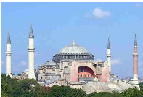
Iglesia de Santa Sofía

La estratificación social era similar a la de Europa, con nobleza, clérigos (personal religioso), mercaderes y comerciantes libres y siervos para el trabajo del campo.