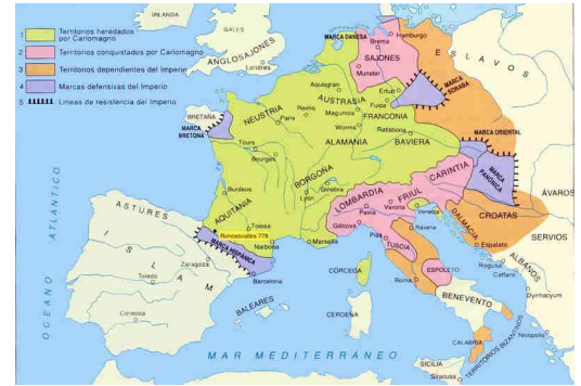
Mapa del Imperio Carolingio

En cuanto a la política, el emperador era el máximo poder, el imperio se dividía en condados con condes encargados de la administración de esas tierras, además algunos territorios fronterizos que eran conocidos como marcas o comarcas a cargo de un marqués. Como la iglesia tenía el control económico y de la forma de pensamiento, en ocasiones entraban en conflicto con la política.